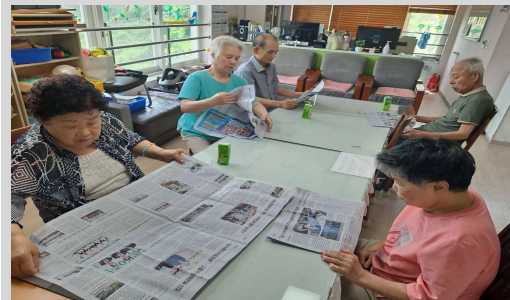
회상활동 // 세상뉴스전하기, 신문보기