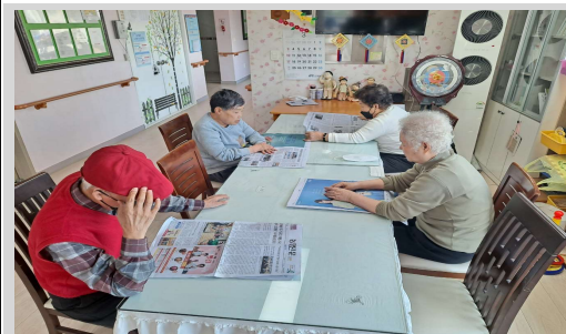
회상활동 // 세상뉴스전하기, 신문보기